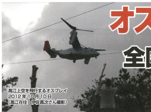
高江上空を飛行するオスプレイ 2012年10月10日

会費集金は会員の心をあつめる活動です 毎月10日までには集めましょう 商工新聞は経営のヒント・くらしの知恵がいっぱい 毎週必ず届けましょう